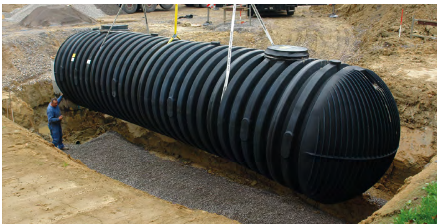
Montáž podzemní nádrže CARAT